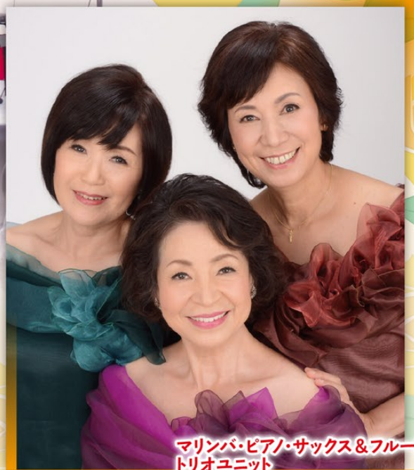
マリンバ・ピアノ・サクソ&フルート トリオユニット