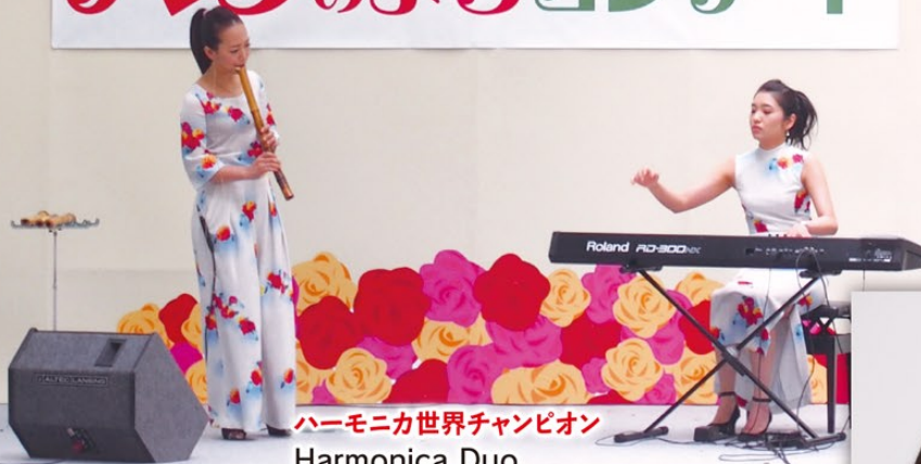
ハーモニカ世界チャンピオン Harmonica Duo